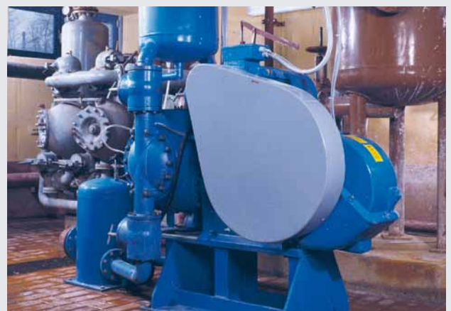
Stabile, solide Konstruktion. ABEL CM-Kolbenmembranpumpe zur Filterpressenbeschickung.