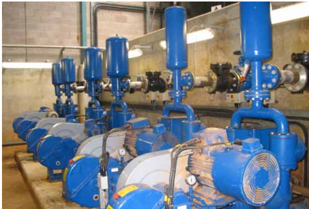
CM-Kolbenmembranpumpen auf einer Wasseraufbereitungsanlage in Nordirland