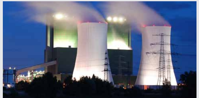
Energie/Kraftwerke - Rauchgasentschwefelung