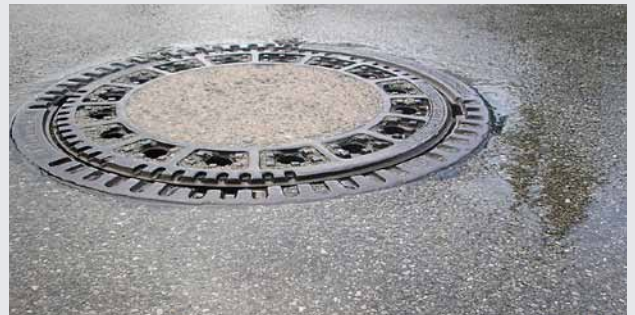
Abwasser - Kläranlagen und Pumpenwerke

ABEL CM Kolbenmembranpumpen ermöglichen die Förderung hochabrasiver, auch kornhaltiger Suspensionen durch den Einsatz von hochfesten Spezial-Membranen und Kugelventilen, die einen Kontakt des Förderguts mit Kolben und anderen mechanischen Regel- und Steuerelementen der Pumpe verhindern. Der Einsatz eines großvolumigen Pulsationsdämpfers vermeidet zuverlässig die Pulsation und somit den diskontinuierlichen Austritt des Förderguts über den gesamten Förderdruckbereich. Ein frequenz geregelter Antrieb ermöglicht eine genaue Anpassung der Förderleistung an den Düsenantrieb und somit eine Druckregelung sowie die Anpassung an eine Verarbeitung unterschiedlicher Schlackerqualitäten zu verschiedenen Granulatqualitäten.