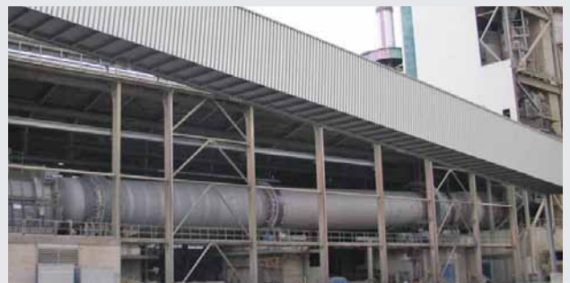
Zementindustrie - Drehrohfenbeschickung