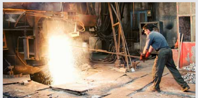
Stahlwerke - Fördern von Beiz- und Zunderschlämmen