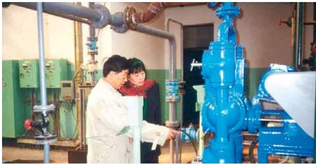
ABEL CM-Pumpe für die Sprühturmbeschickung