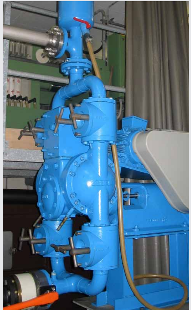
Kugelveile mit Revisionsöffnungen und Membranleckageanzeige

Es sind die technischen Details, die ABEL Kompaktmembranpumpen so unvergleichlich in Funktion und Qualität machen.