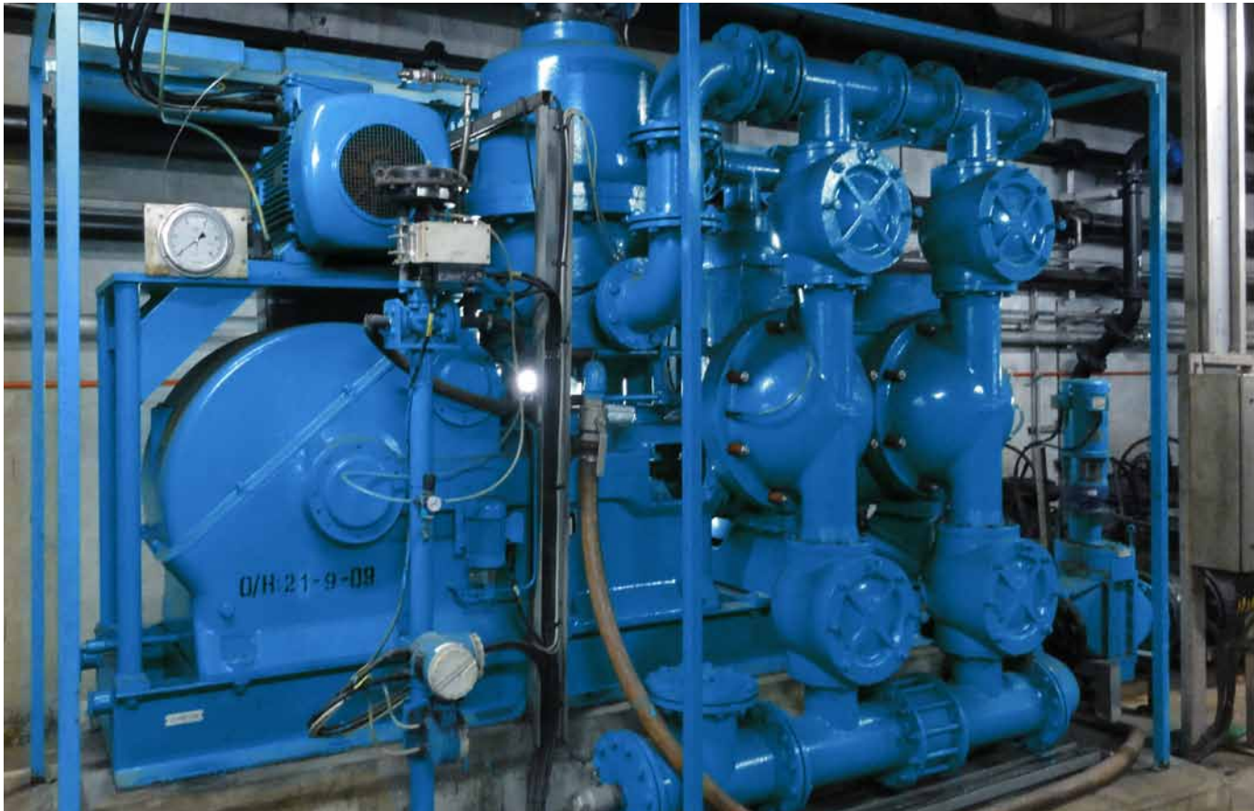
ABEL-Kolbenmembranpumpe der CM-Baureihe für Rohabwassertransport auf einer Großkläranlage in Asien

Leistungsbereich: bis zu 30 m 3 /h; bis 2,5 MPa