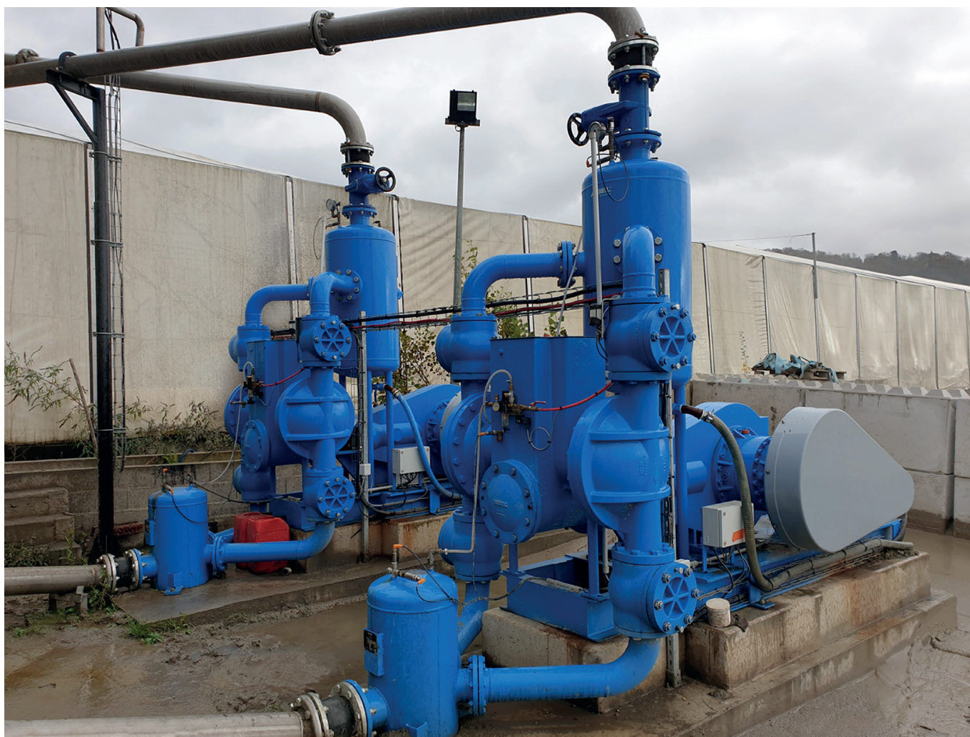
Bild 1: Bei der französischen Firma Solvalor werden Abel HM-Pumpen bei der Filterpressenbeschickung eingesetzt, die mit SPA überwacht werden.

Während der SPA 1.0 sich zunächst noch auf das Monitoren der Daten sowie das Versenden von Alarmmeldungen bei Grenzwertüberschreitungen beschränkte, macht der kürzlich gelaunchte SPA 2.0 einen großen Schritt in Richtung „Predictive Maintenance“. Die neue Version zeichnet sich durch ein erweitertes Sensorkonzept